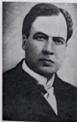
Retrato de Rubén Darío.

Donald Shaw, La generación del 98 (Madrid, Cátedra, 1977)